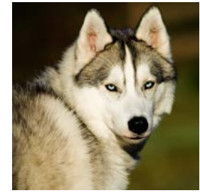
Projekt Strassennasen e.V.